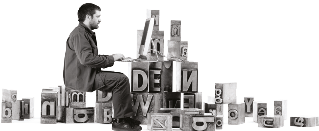
Illustrasjon: Espen Hartz